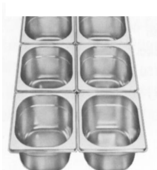
Gastronorm 1/6 (176 x 162 mm)