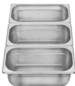
Gastronorm 1/3 (176 x 325 mm)