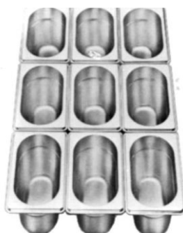
Gastronorm 1/9 (176 x 108 mm)