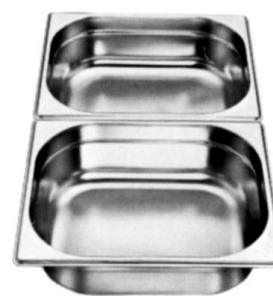
Gastronorm 1/2 (265 x 325 mm)