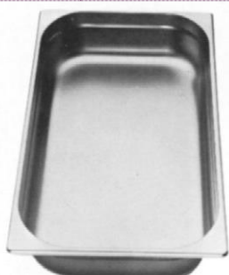
Gastronorm 1/1 (530 x 325 mm)