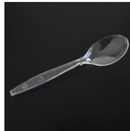
9072 / 9073