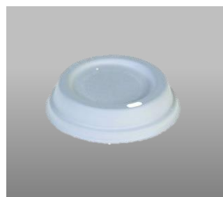
90401 / 90411